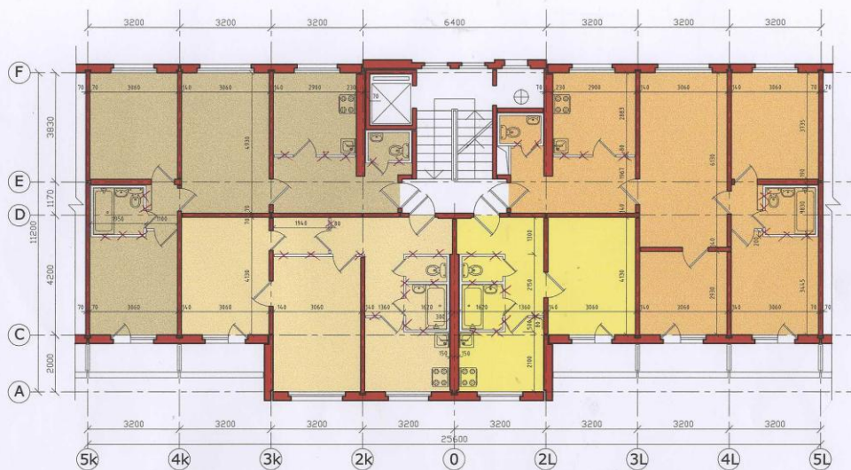
9 stāvu dz/ēka, tipa stāva plāns Sērija 1LV-602 R Bloka sekcija 1-2-3-4 R (rindu)

Pielikumā pievienoti dzīvokļu plāni ar X atzīmēm, kuras sienas ir nenesošās un pieļaujamas nojaukšanai.