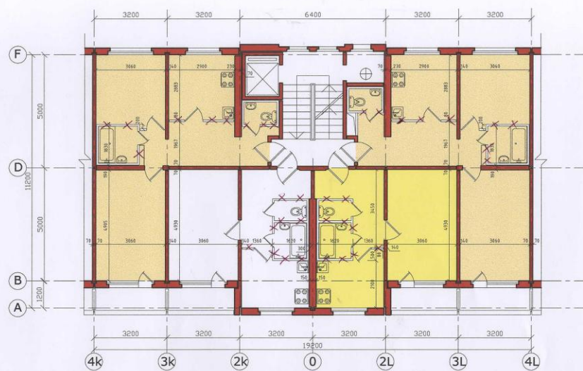
9 stāvu dz/ēka, tipa stāva plāns Sērija 1LV-602 R Bloka sekcija 1-1-2-2 R (rindu)